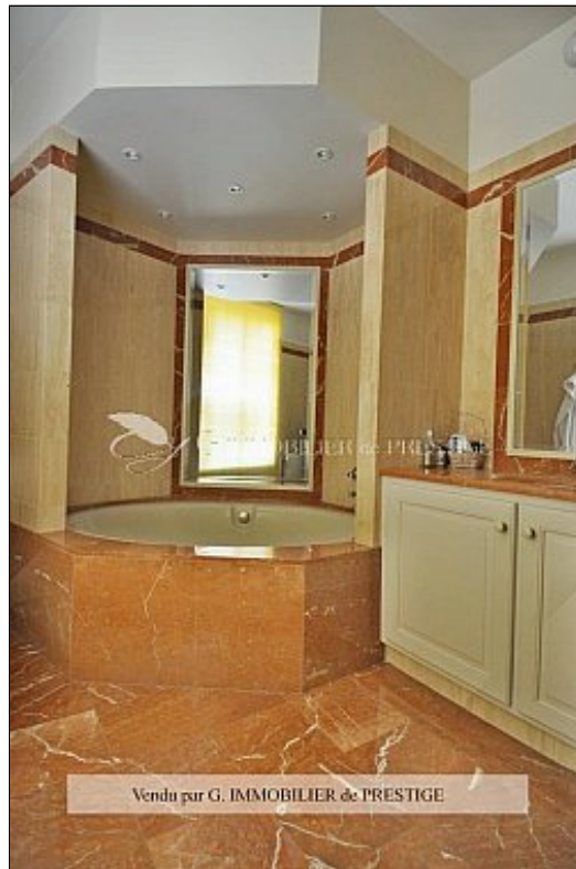
G. IMMOBILIER de PRESTIGE