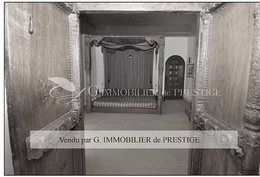
G. IMMOBILIER de PRESTIGE