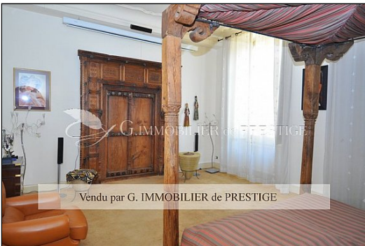
G. IMMOBILIER de PRESTIGE