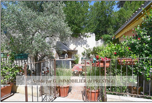
Vendu par G. IMMOBILIER de PRESTIGE