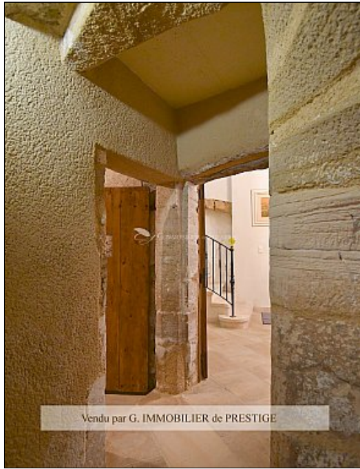
Vendu par G. IMMOBILIER de PRESTIGE