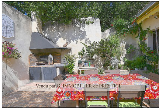
Vendu par G. IMMOBILIER de PRESTIGE