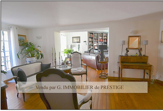
Vendu par G. IMMOBILIER de PRESTIGE