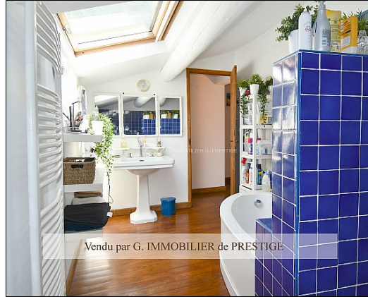
Vendu par G. IMMOBILIER de PRESTIGE