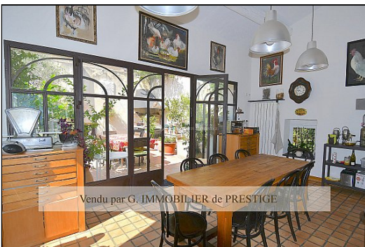
Vendu par G. IMMOBILIER de PRESTIGE