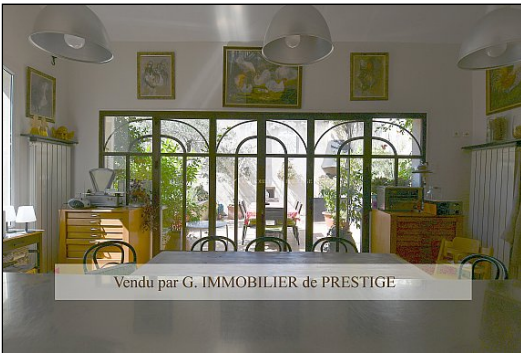
Vendu par G. IMMOBILIER de PRESTIGE