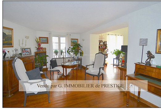
Vendu par G. IMMOBILIER de PRESTIGE