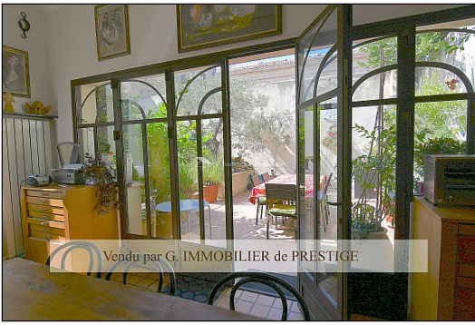
Vendu par G. IMMOBILIER de PRESTIGE