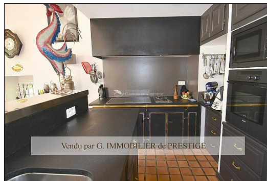
Vendu par G. IMMOBILIER de PRESTIGE