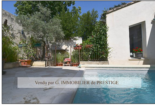
Vendu par G. IMMOBILIER de PRESTIGE