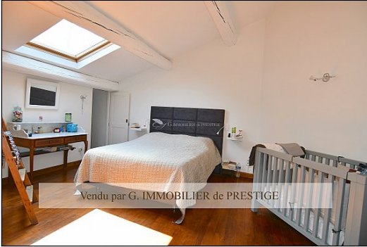
Vendu par G. IMMOBILIER de PRESTIGE