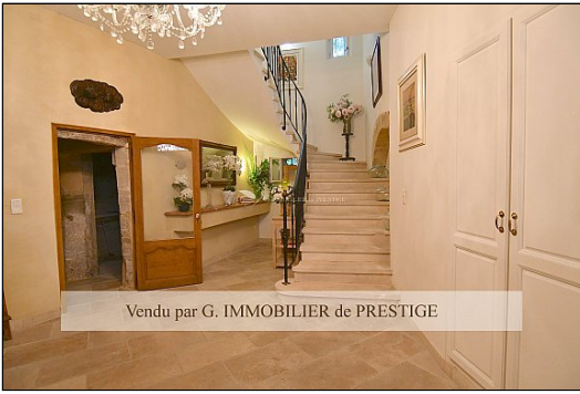
Vendu par G. IMMOBILIER de PRESTIGE