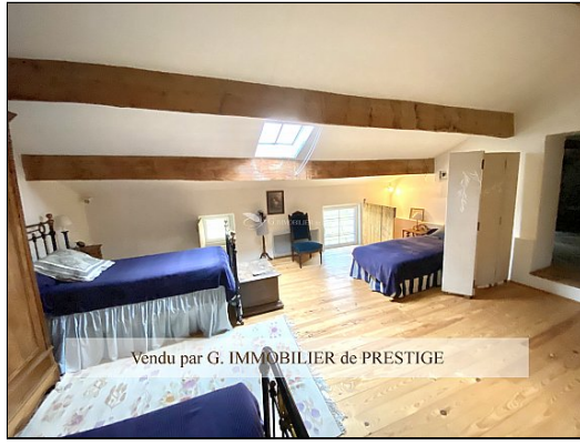
Vendu par G. IMMOBILIER de PRESTIGE