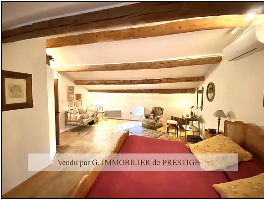
Vendu par G. IMMOBILIER de PRESTIGE