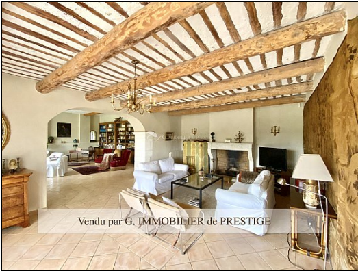
Vendu par G. IMMOBILIER de PRESTIGE