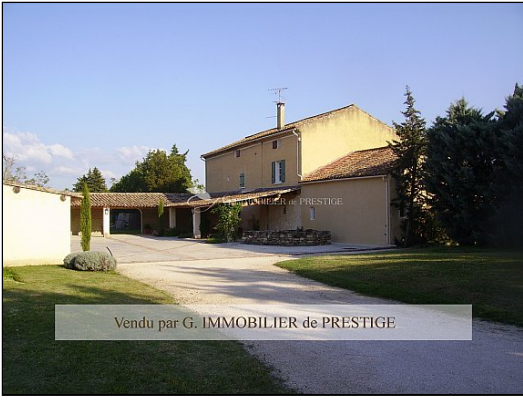
Vendu par G. IMMOBILIER de PRESTIGE