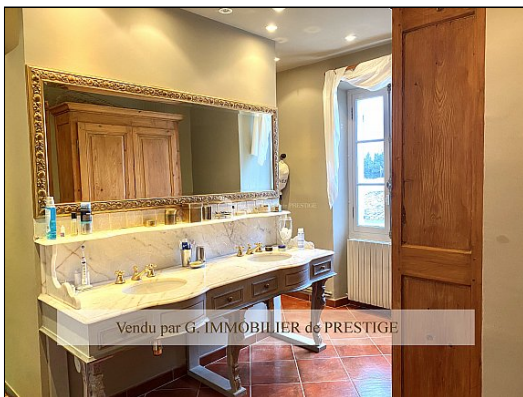
Vendu par G. IMMOBILIER de PRESTIGE