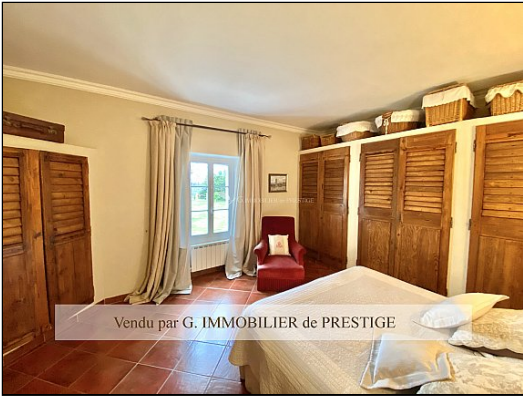
Vendu par G. IMMOBILIER de PRESTIGE