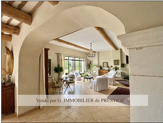
Vendu par G. IMMOBILIER de PRESTIGE